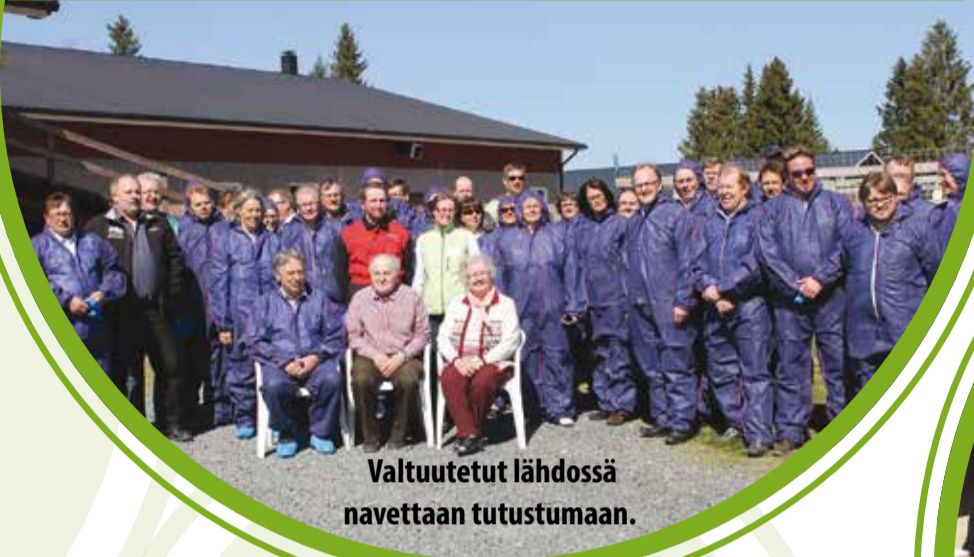
Valtuutetut lähdössä navettaan tutustumaan.