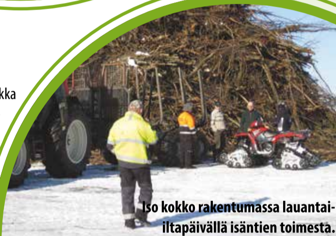
Iso kokko rakentumassa lauantai-iltapäivällä isäntien toimesta.