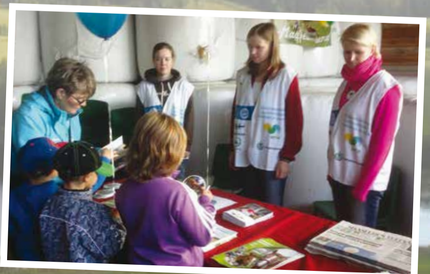
Lasten maatalousnäyttely Haapajärvellä syyskuu 2013.