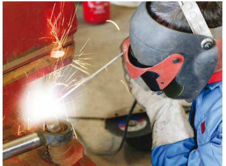
Maatilayrittäjän voimassa oleva tulityökortti on yksi konkreettinen turvateko, joka tuo pisteitä maatilan turvallisuuskartoituksessa.

Paloturvallisuuden lisäksi maatilan turvallisuuskartoituksessa kannustetaan pisteytyksellä maatilayrittäjää kiinnittämään huomiota ympäristöriskien huomioimiseen. Lisäpisteitä saa myös työterveyshuoltoon kuulumisesta. Tällä viimeksi mainitulla on selvä yhteys henkilöriskien vähentämiseen.